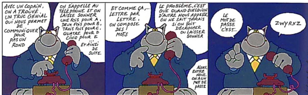
Le chat de Philippe Geluck

De nos jours, le codage d'un message pour le transmettre secrètement est devenu courant, par exemple lors de la communication de données personnelles sur un site web sécurisé (voir https://interstices.info/jcms/int_63483/a-propos-de-la-cryptographie ). Dans cette activité, nous allons voir différentes façons de coder un message.